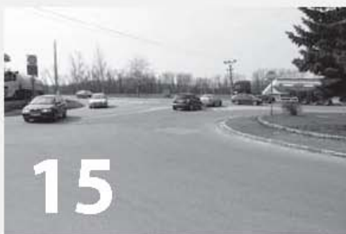
Setkání s občany