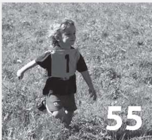
Sport - 12. ročník Knířovského běhu