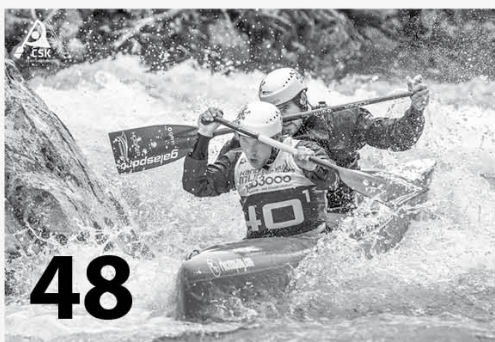
Sport a volný čas - kanoistika