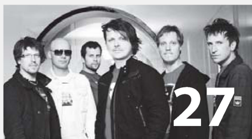
Benefiční koncert - Chinaski