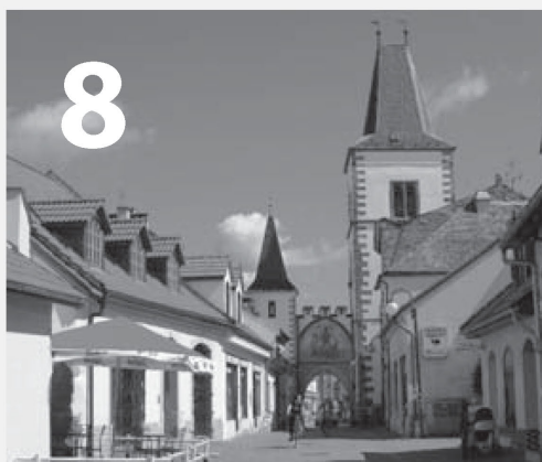
Dny evropského kulturního dědictví